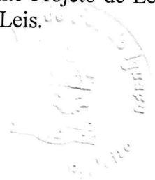
Francisco Lacerda Brasileiro Prefeito Municipal